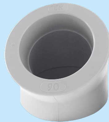
Cot 45°, 90 mm, PPR

Rezistența ridicată a materialului PP-RCT, permite o reducere a grosimii peretelui.