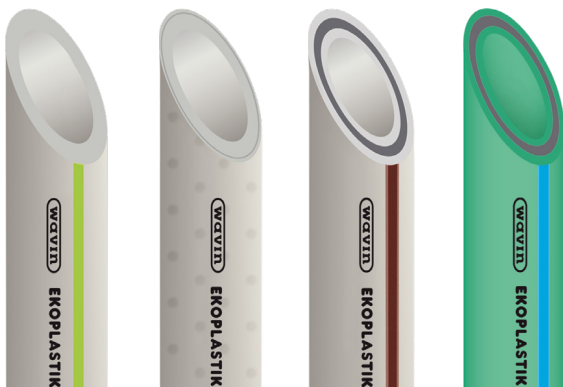
Ekoplastik EVO PP-RCT Ø 16 –125mm